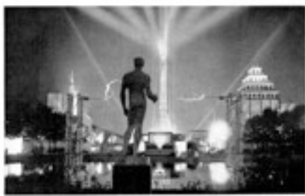
En 1937, dans sa situation d'origine. Ci-dessous dans le hall de l'immeuble «Vienne»