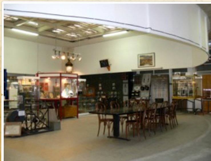
La salle d'exposition de St Ouen au 01/04/2009