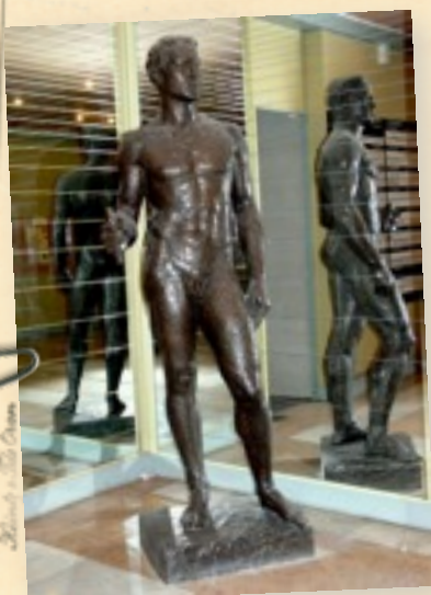
Sur le site Vienne